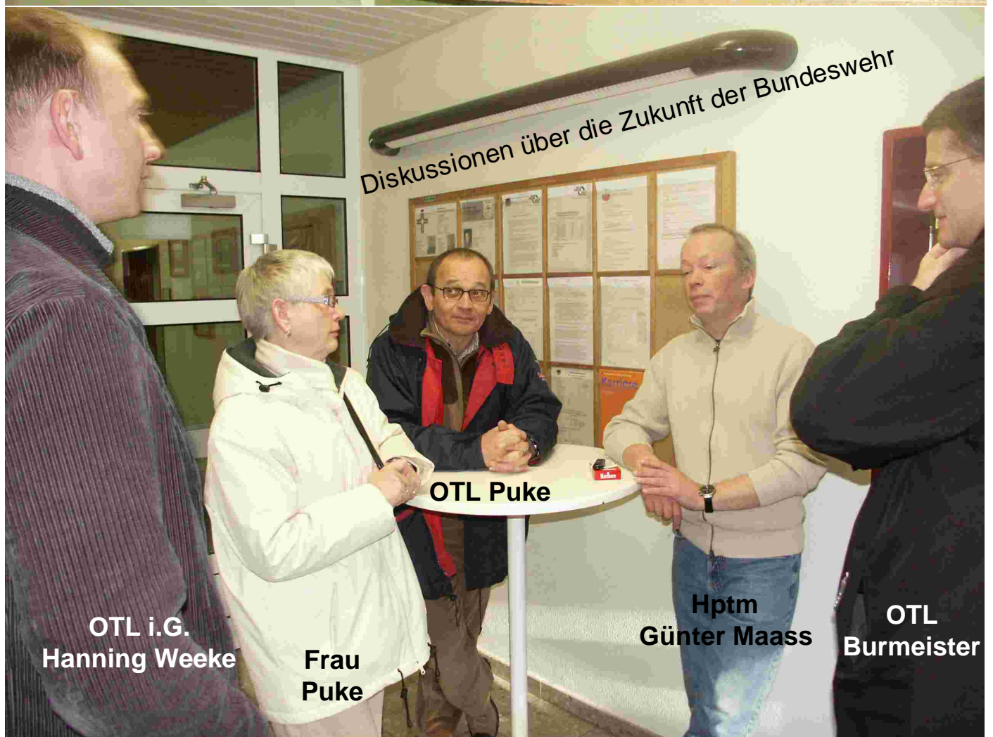
OTL i.G. Hanning Weeke

Diskussionen über die Zukunft der Bundeswehr