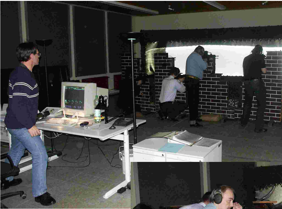
Ein Besuchermagnet war auch wieder das Schießen am AGSHP.

Wer ist der Beste? Diese Frage haben wir nicht beantwortet, aber eifrig bei der Sache waren alle.