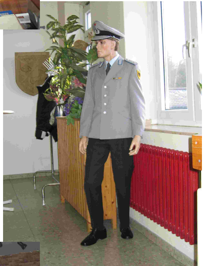
Dienstanzug mit „Zweitaschenjacke“